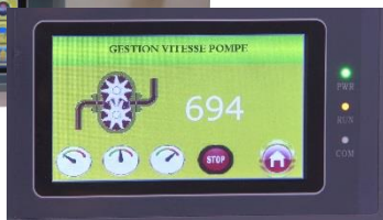
Ecran tactile de contrôle

Double tapotage Chauffage ventilation avec réglage de température Réglage hauteur goulotte et ventilation par vis « Speedy » Grille filtrante chauffante