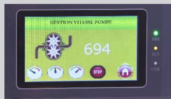
Ecran tactile de contrôle